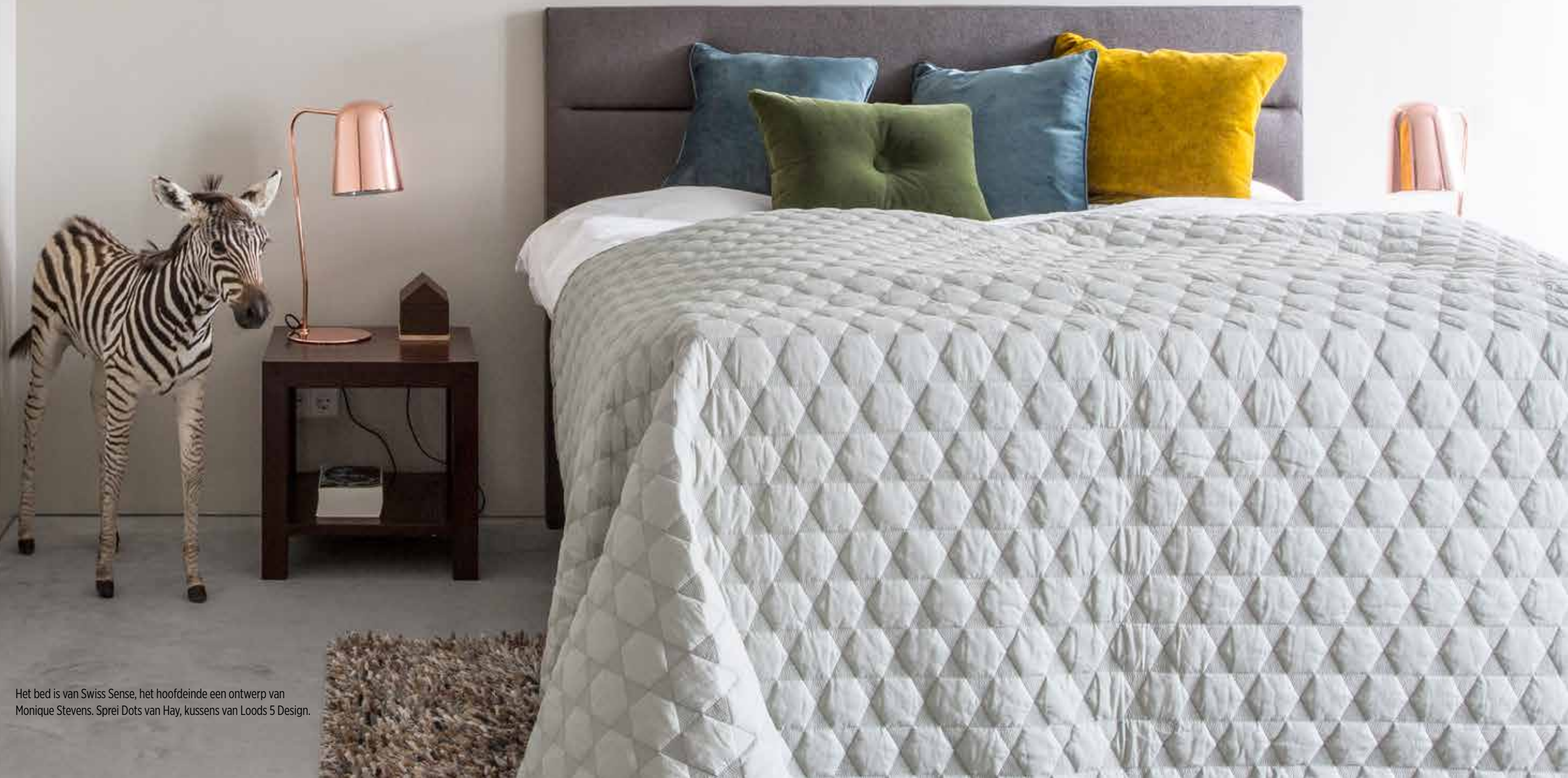
Het bed is van Swiss Sense, het hoofdeinde een ontwerp van Monique Stevens. Sprei Dots van Hay, kussens van Loods 5 Design.

‘De betonvloer voelt verbazingwekkend zacht, zeker met de vloerverwarming aan’